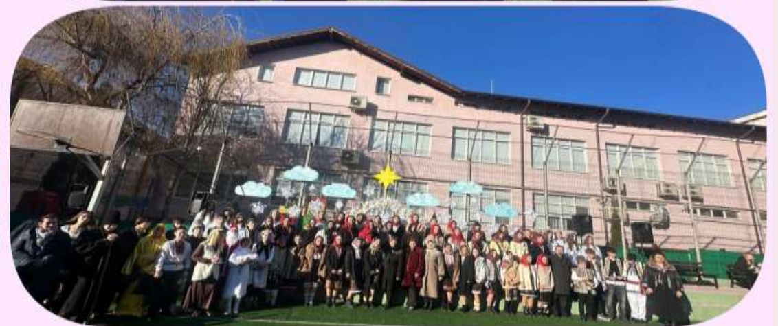
Serbare de colinde în curtea Școlii Gimnaziale Miron Costin